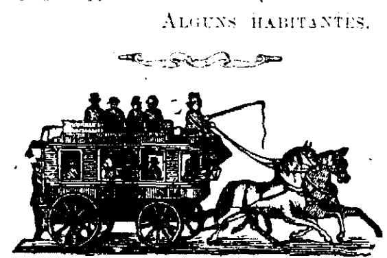
Companhia Ferro Carril Parahybana